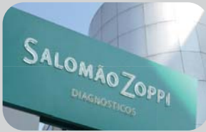
Ibirapuera Av. Divino Salvador, 876