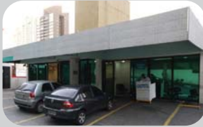
Panamby Rua Algemesi, 76