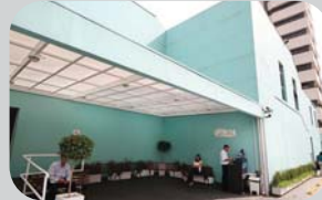
Paraíso Rua Correia Dias, 48