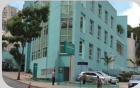
Portal do Morumbi Rua Prof. Hilário Veiga de Carvalho, 312