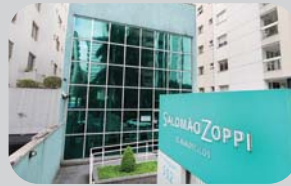
Moema Rua Araguari, 552