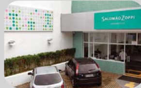
Tatuapé Praça Sílvio Romero, 193